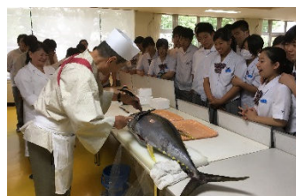
大きなマグロを目の前に大興奮!!

3年生を対象に本校の概要説明と本校調理師養成学科戸村専任講師による「マグロの解体ショー」を実施。奄美から直送した約20kgのキハダマグロを目の前