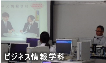
ビジネス情報学科

夏休み期間に行われた体験入学は、島外の高校生とご家族や社会人の方、島内の高校生や社会人の方々が多数参加されました。今回は7月22日(土)に行われた島外生対象の体験入学の様子をご紹介します。毎回、それぞれの学科でテーマを変え、特色ある体験入学を行っています。島外から来校される皆様に少しでも多くのお伝えするため、さらに内容を充実させて体験をしていただいています。進路選択の大事な時期でもあり、各学科での体験に真剣に取り組んでいました。