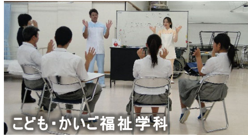
こども・かいご福祉学科